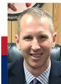
Wallace Town Mayor Jason Wells