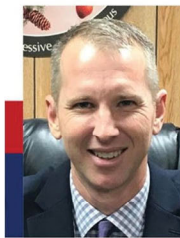
Alcalde de Wallace Town Jason Wells

El Ayuntamiento y yo discutiremos la mejor manera de utilizar estos fondos para estos proyectos en los próximos meses.